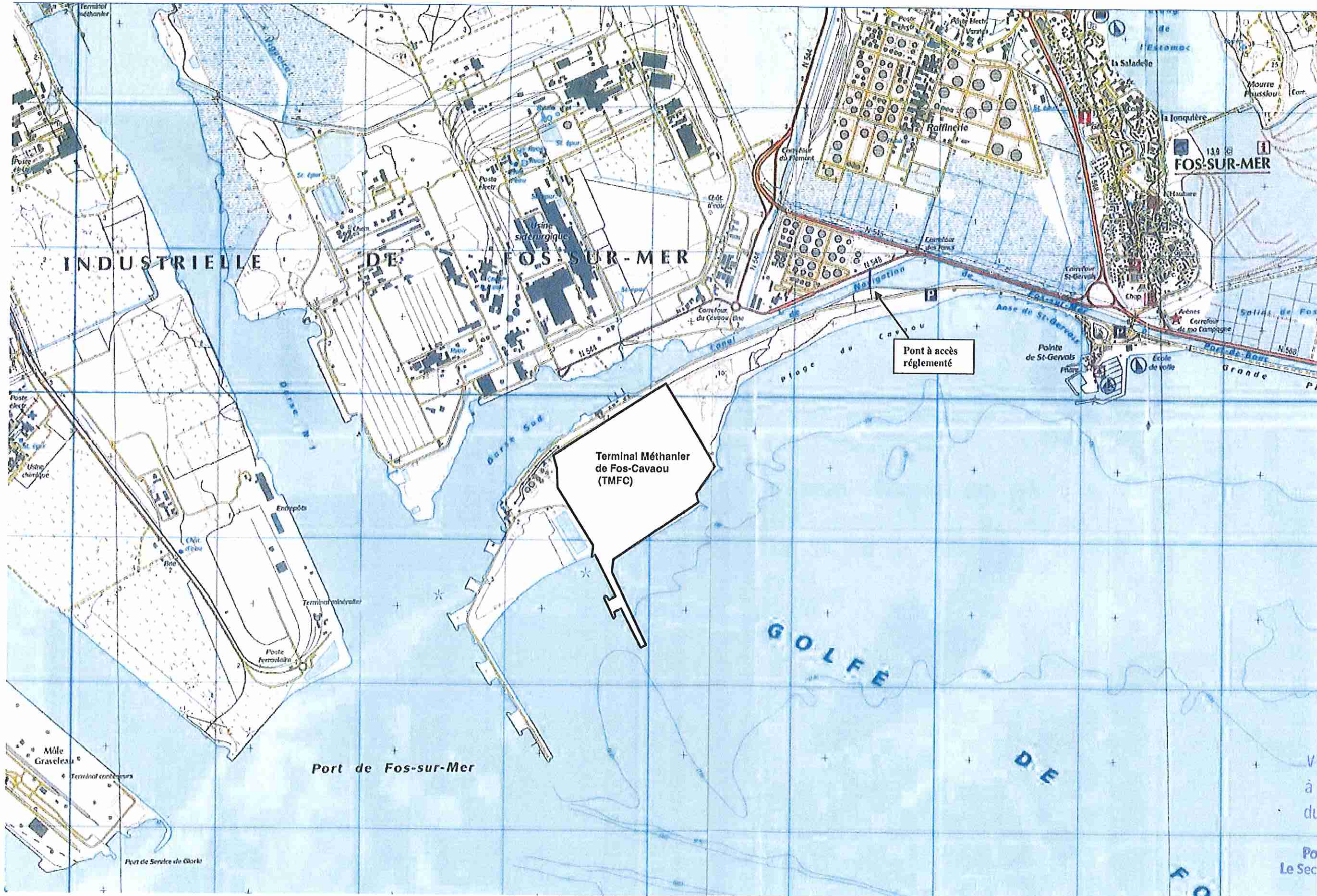
Figure 1 : Extrait de la carte IGN 3044 OT (Echelle 1/25 000ème)

Vu pour être annexé à l'arrêté n° 166 - 2014 du 3 FEV. 2014 Pour le Préfet Le Secrétaire Général