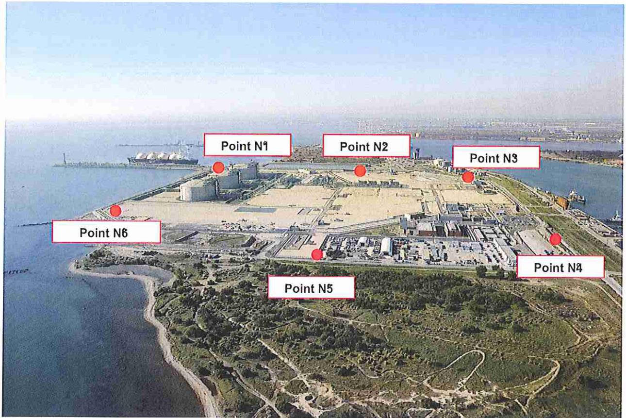
Photo aérienne du terminal méthanier

Vu pour être annexé à l'arrêté n° 144 - 2011 A du 13 FEV. 2012