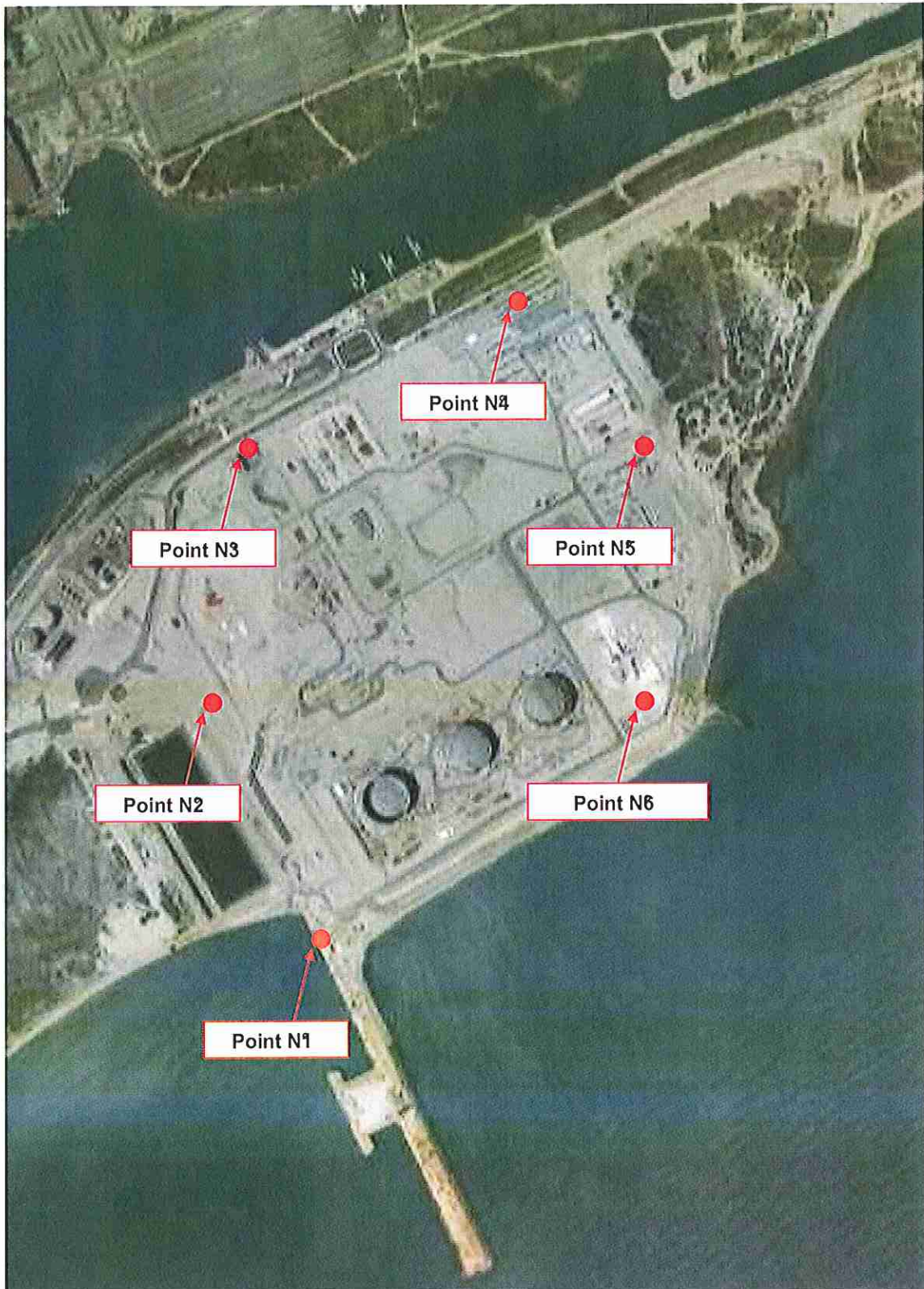
Vue Google Earth

Vu pour être annexé à l'arrêté n° 144-2011 du 14/01/2011 Pour le Préfet Le Secrétaire Général